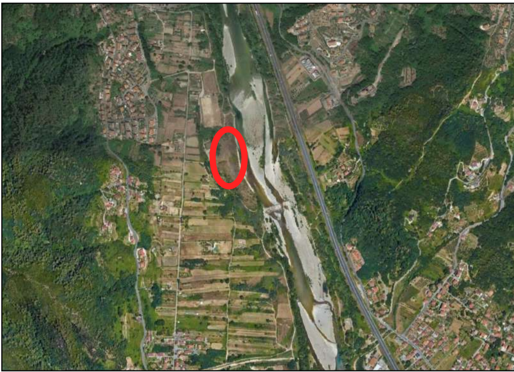
Ubicazione del sito riferita alla nuova versione del P.T.C.P.