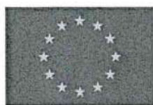
Unione europea Fondo sociale europeo